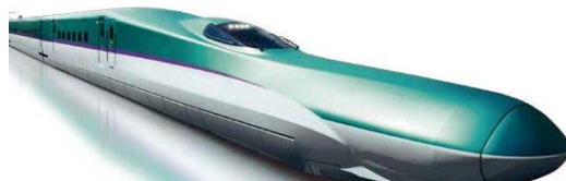
函館も 新幹線で 行けるのね(青木)