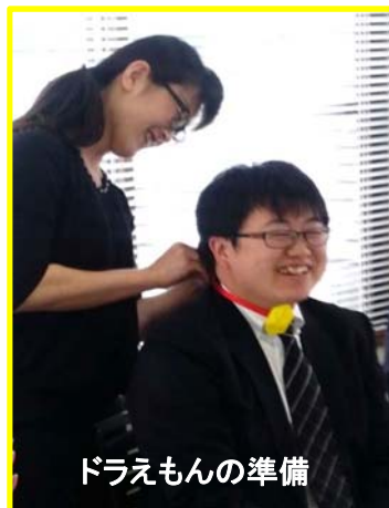
ドラえものの準備